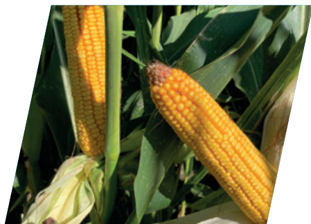
/// DKC4712, Jákfa, 2020

...akik nem preferálják a tőszámsűrítést és kifejezetten attraktív, nagy csövek látványát kedvelik. Egyik legújabb nemesítésű mestermunka az éréscsoportjában, terméspotenciálja csúcskategóriás, mely gyors vízleadással és kiváló csőegészséggel párosul.