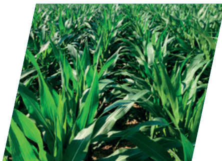
/// DKC4712, Sárbogárd, 2021