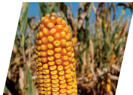
/// DKC4712, Sárvár, 2020